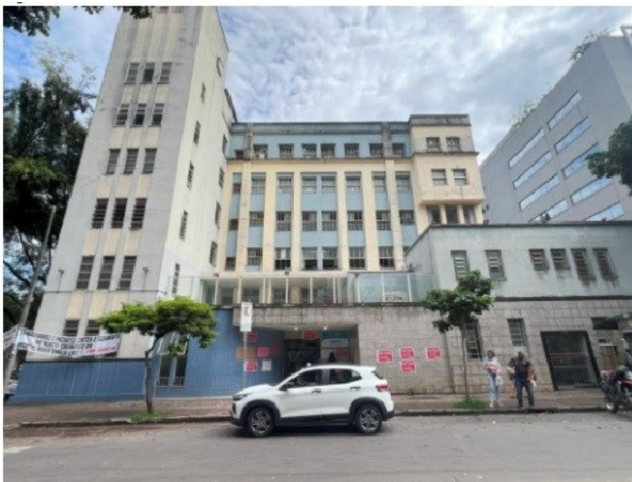
Figura 1: HMAL