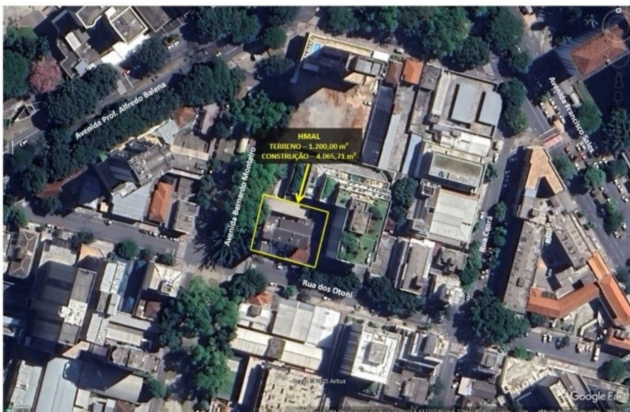
Figura 2: HMAL

6.3 A área a ter cedido/permitido o uso gratuito abarca toda parte física do HMAL, tais como leitos, consultórios, salas e demais espaços, conforme detalhado abaixo: